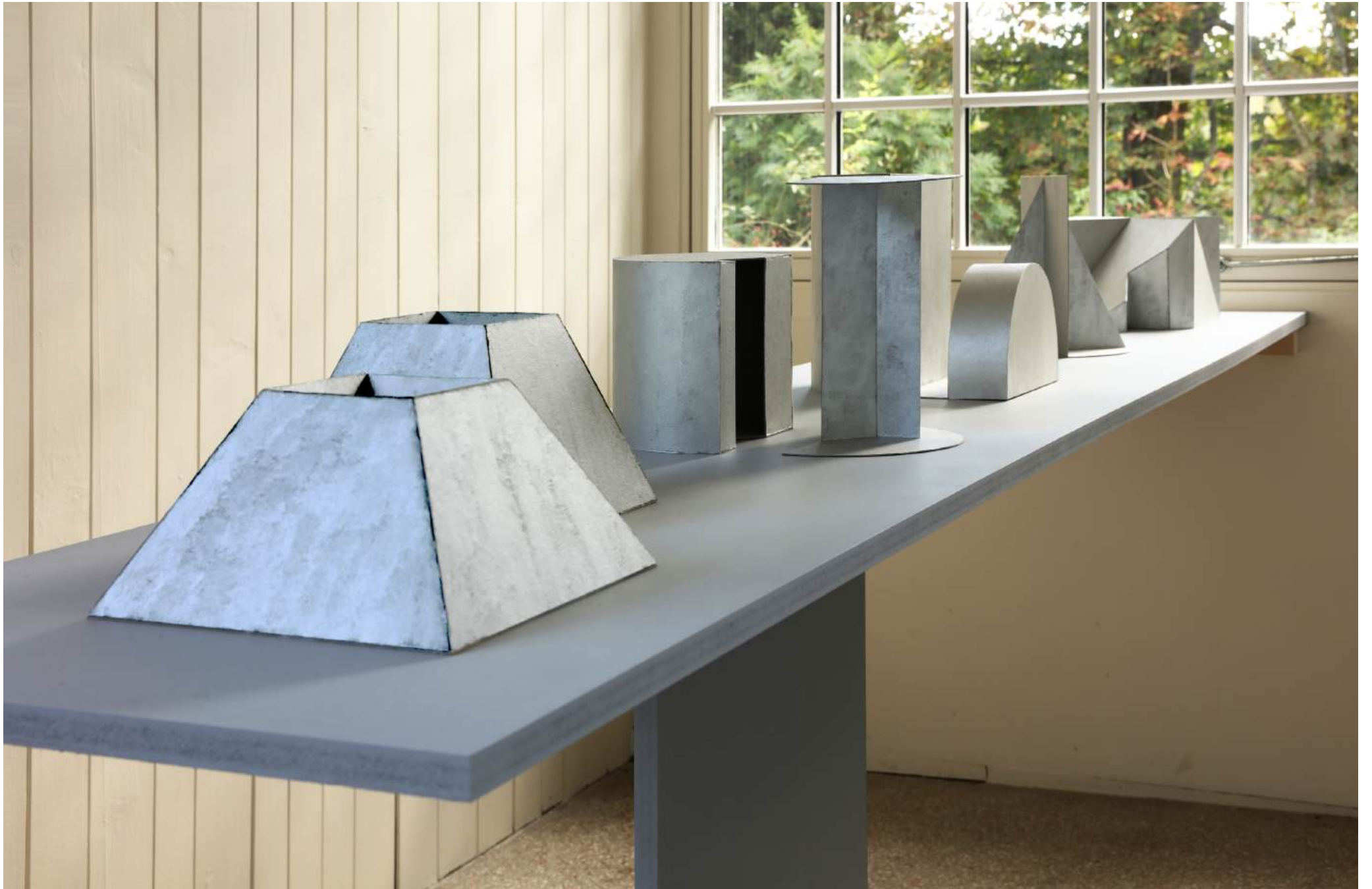
Michał Budny, "Keyhole", Installation View, annex14 bis , 2024