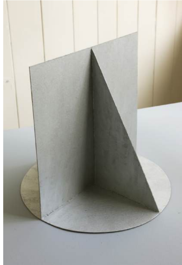
Michał Budny, "Keyhole", Installation View, annex14 bis , 2024 Untitled (Attempted Fullness), 2024 cardboard, silver purest pigment acrylic paint, 23.5 x 23.5 x 23.5 cm