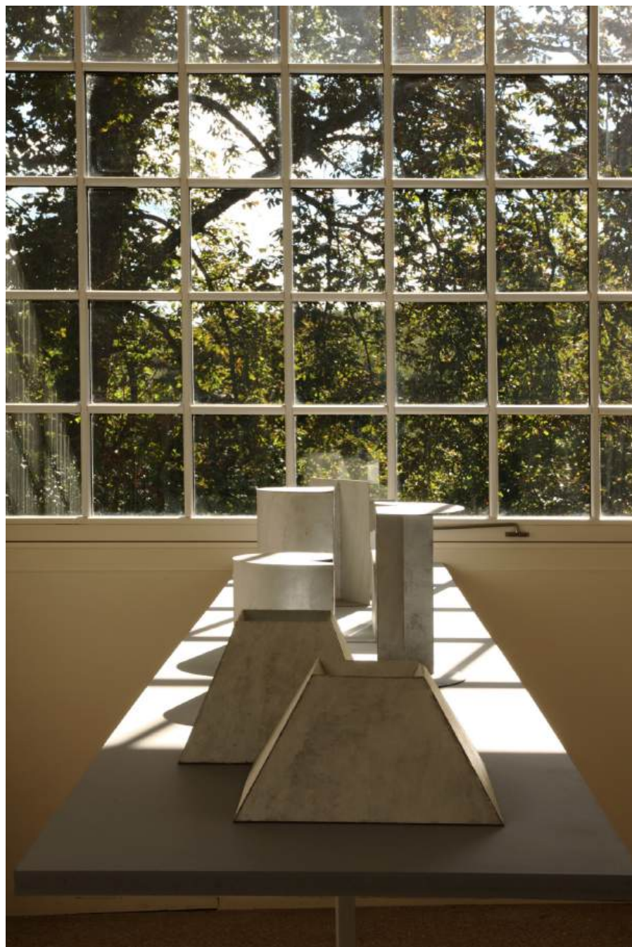
Michał Budny, "Keyhole", Installation View, annex14 bis , 2024