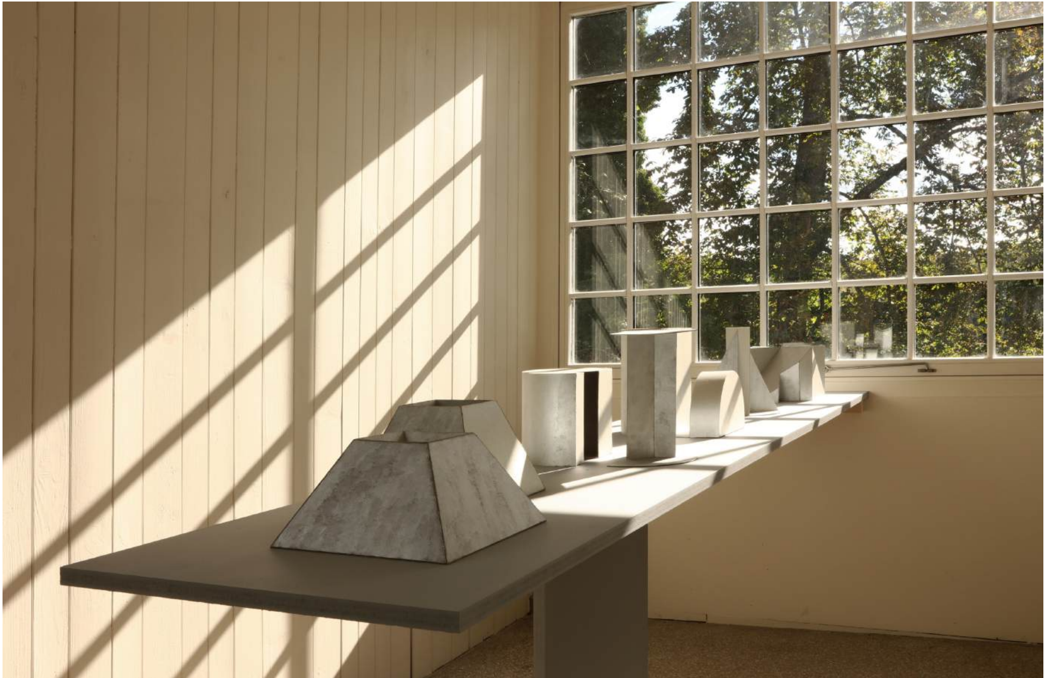
Michal Budny, "Keyhole", Installation View, annex14 bis , 2024