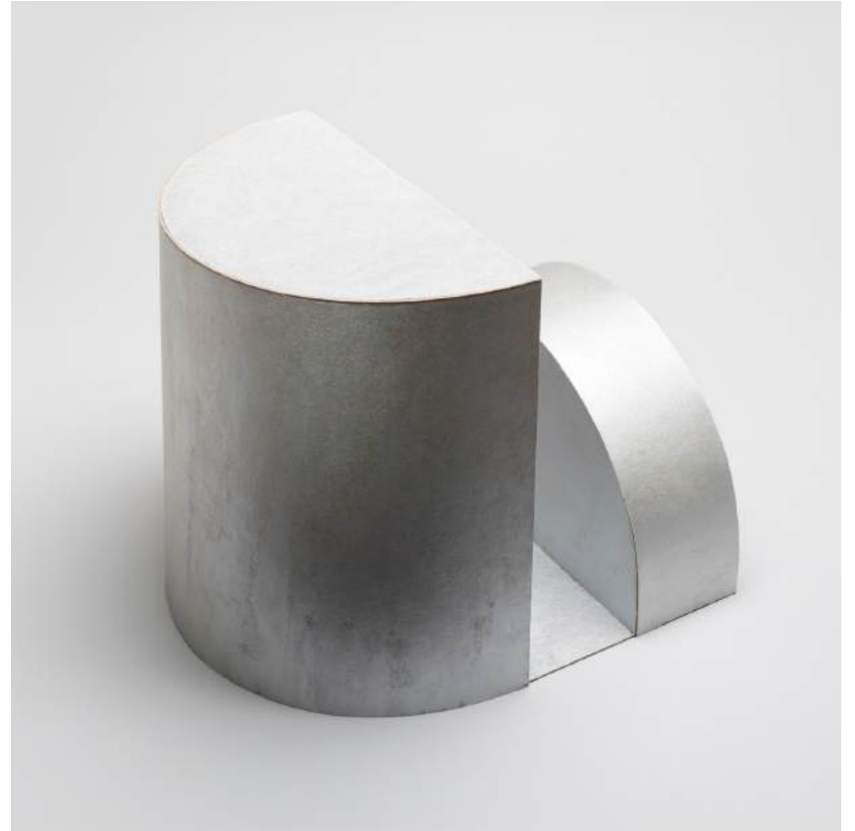
Michal Budny, Untitled (Memory) , 2024 cardboard, silver pigment acrylic paint, 23.5 x 23.5 x 26 cm