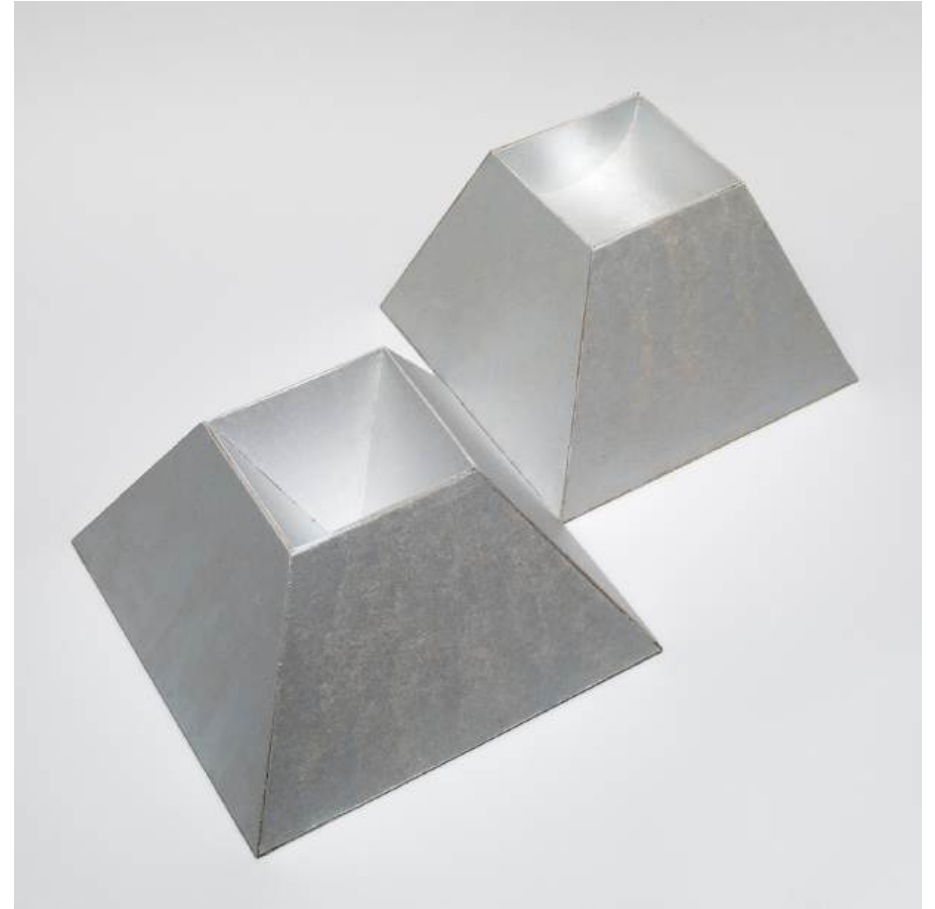
Michal Budny, Untitled (Science and Faith), 2024 cardboard, silver purest pigment acrylic paint part one: 12 x 23.5 x 23.5 cm; part two: 14 x 21 x 21 cm