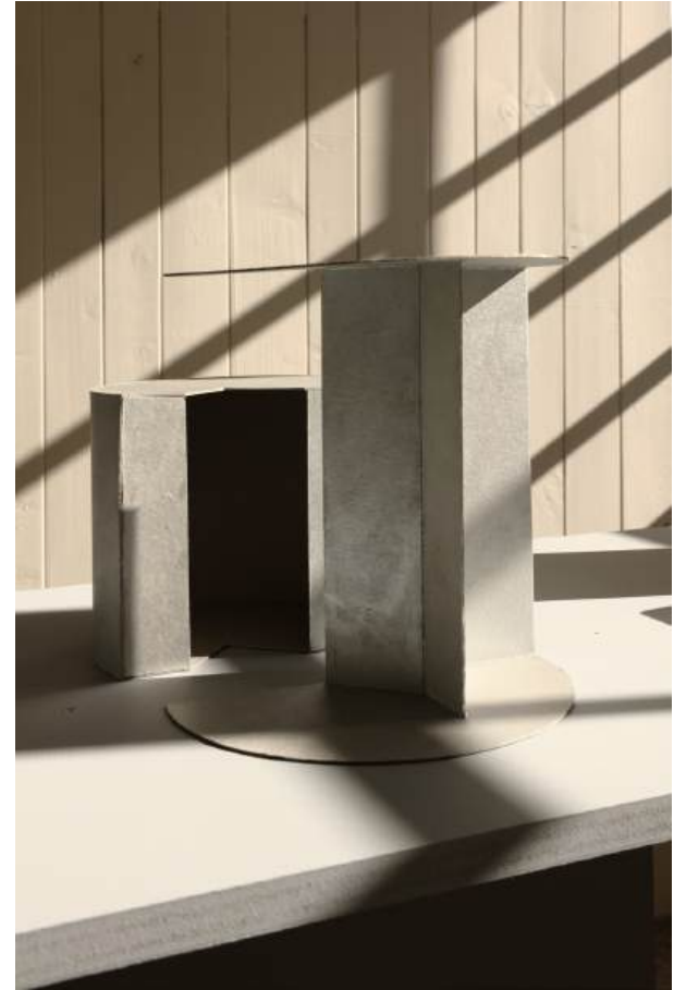
Michał Budny, "Keyhole", Installation View, annex14 bis , 2024 Untitled (Dependency), 2024 cardboard, silver pigment acrylic paint part one: 16 x 13.5 x 19 cm; part two: 23.5 x 12.5 x 21.5 cm