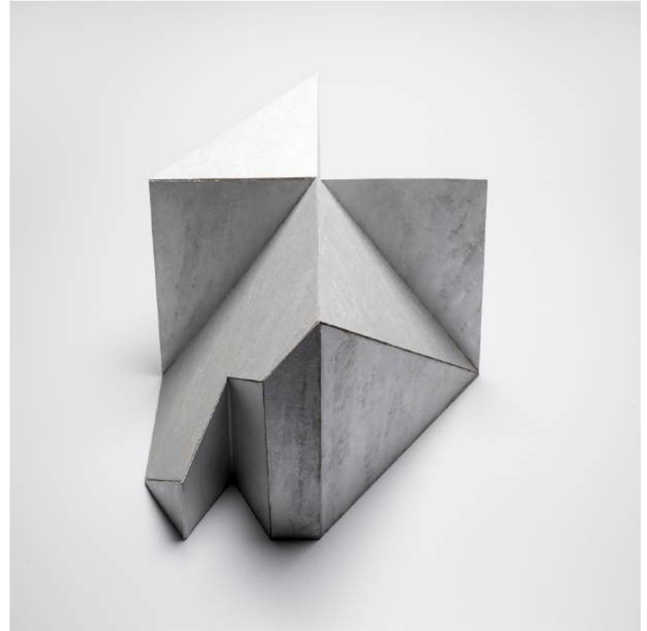
Michal Budny, Untitled (Transformation), 2024 cardboard, silver purest pigment acrylic paint, 17 x 24 x 31 cm