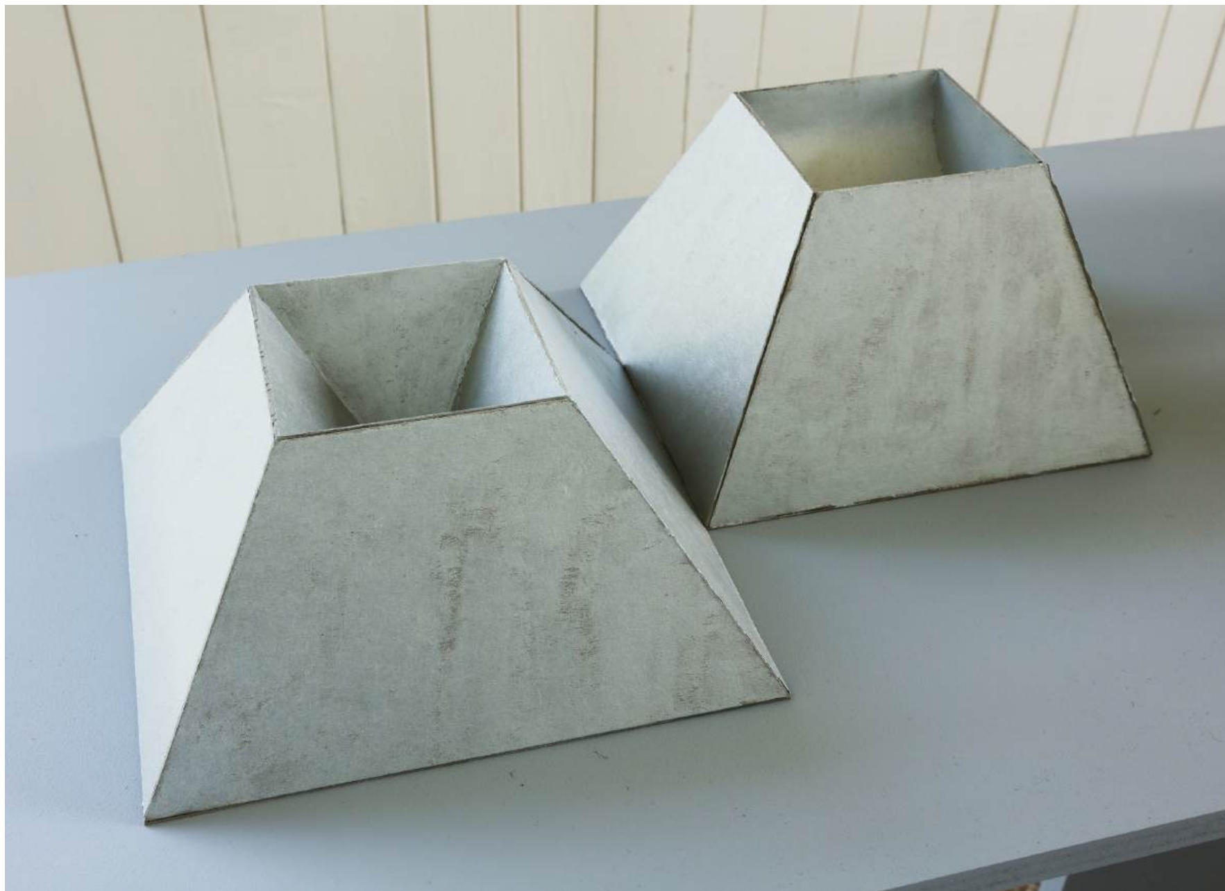
Michał Budny, "Keyhole", Installation View, annex14 bis , 2024 Untitled (Science and Faith), 2024 cardboard, silver purest pigment acrylic paint part one: 12 x 23.5 x 23.5 cm; part two: 14 x 21 x 21 cm