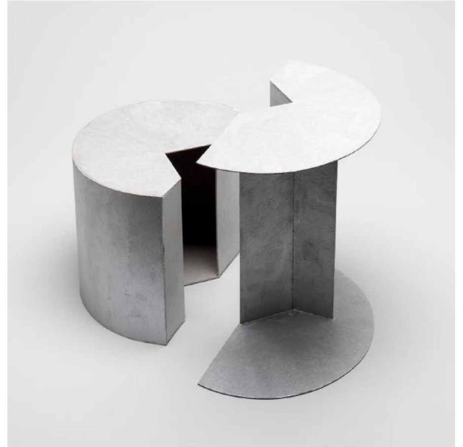
Michal Budny, Untitled (Dependency), 2024 cardboard, silver purest pigment acrylic paint part one: 16 x 13.5 x 19 cm; part two: 23.5 x 12.5 x 21.5 cm