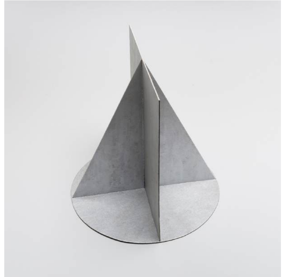
Michal Budny, Untitled (Attempted Fullness) , 2024 cardboard, silver purest pigment acrylic paint, 23.5 x 23.5 x 23.5 cm