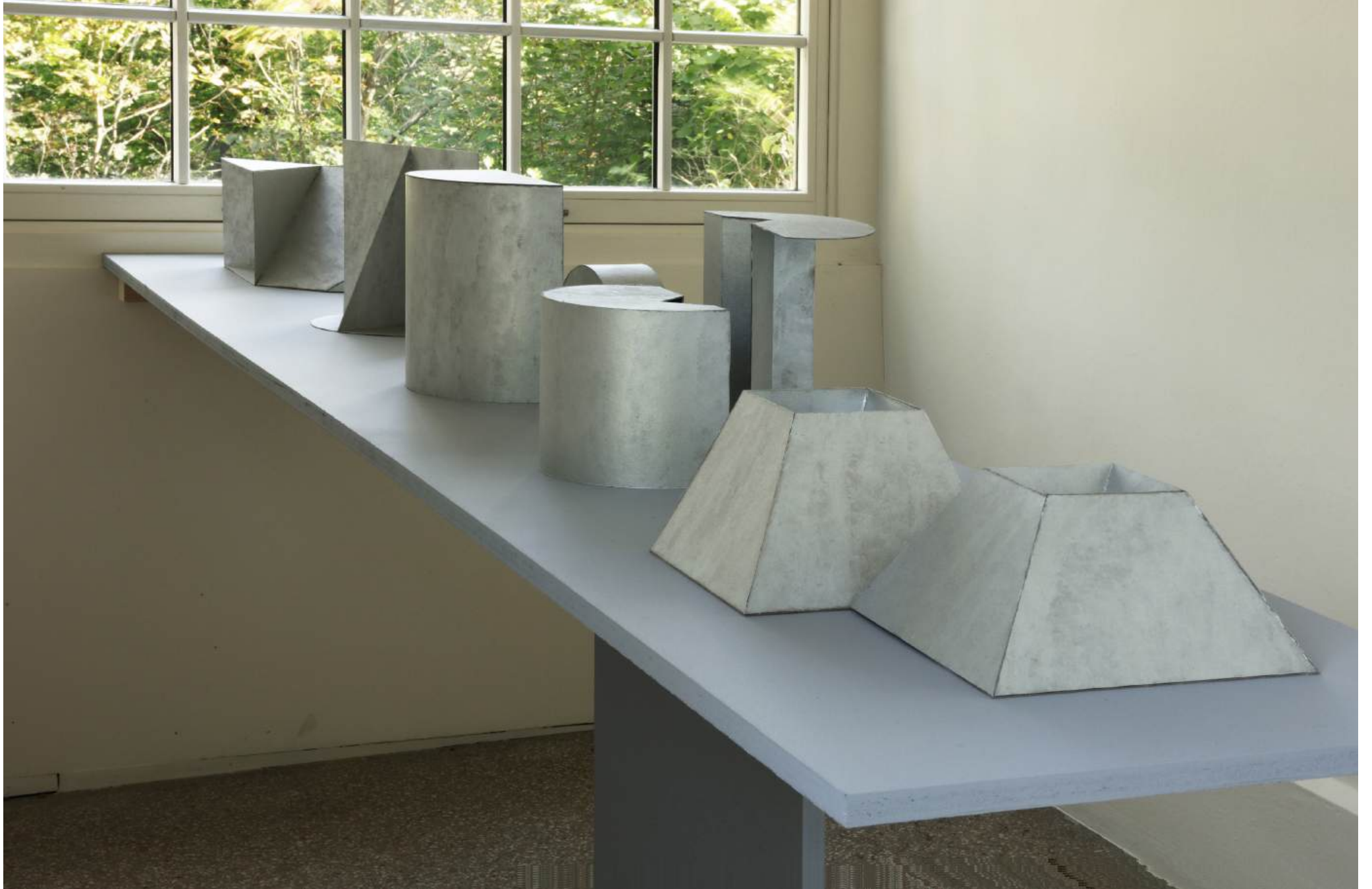
Michał Budny, "Keyhole", Installation View, annex14 bis , 2024